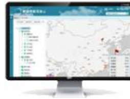
工业数据应用平台