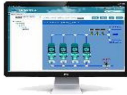
设备远程运维平台