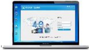
设备远程维护快线